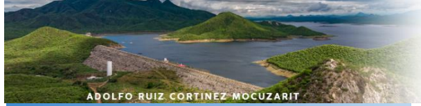
ADOLFO RUIZ CORTINEZ MOCUZARIT