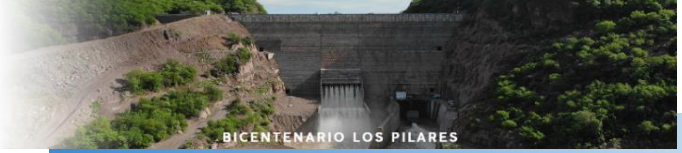
BICENTENARIO LOS PILARES